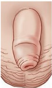
Pene no circuncidado